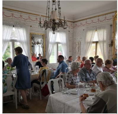
Kuva on kesän 2019 Raumanretkeltä

Kaksi Nummenpakanviikkoa on jäänyt järjestämättä, kaksi kesäretkeä tekemättä, kokoukset ja koulutukset on pidetty etänä. Onneksi on ollut edes ne.