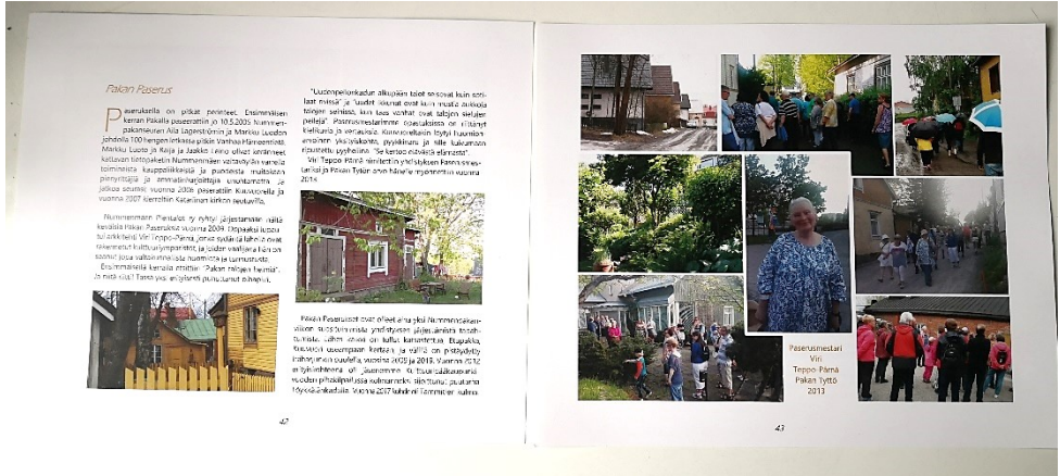
Kuva Pakan Paserus-aukeamasta

Voit tilata kirjan myös toimitettavaksi postitse. Hintaan lisätään postituskulut 8,40 € ja kirjekuori 0,60 €. Toimitus tapahtuu vasta, kun kokonaishinta 29 € on maksettu yhdistyksen tilille. Tilinumeron saat vastauksena tehtyäsi tilauksen joko sähköpostilla osoitteeseen pakanpientalot@gmail.com tai teksti/WhatsApp viestinä numeron 040 514 6896 . Muista nimi ja täydellinen osoite!